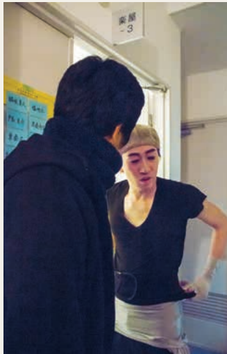
休憩中は舞台裏に行き、音響に問題ないか俳優たちに確認。