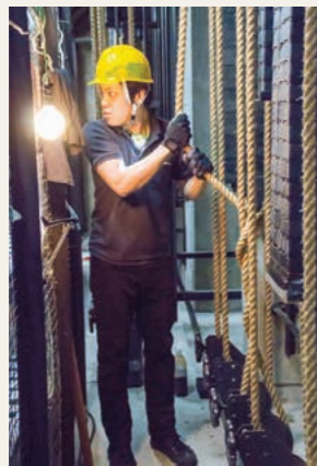
舞台上に吊るされた俳優用のスピーカー(写真上)。隣の照明とぶつからないよう、注意深くバトンを昇降する(写真下)。

全体合わせて150～200kgほどあるメインのスピーカーを、ベルトでしっかり固定。スピーカーをまっすぐ立たせるようにするため、底面に板をかませ角度を調整。