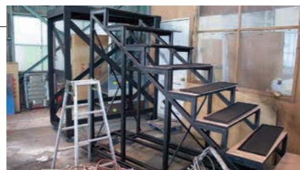
最後のシーンで重要な役割を担う階段。

今回、舞台装置の製作は俳優座劇場に依頼。これまでも『クレイジー・フォー・ユー』など劇団四季の舞台美術製作をお願いしてきた、頼もしい会社です。搬入に向け、工場での作業もいよいよ大詰めです。