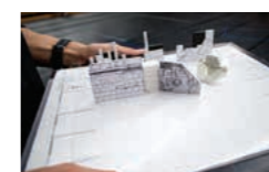
舞台装置の簡易模型。