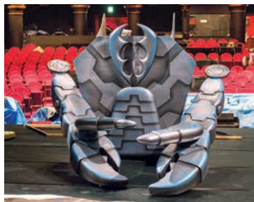
カニロボットもピカピカに。仕込み作業を見守るかのようにはたずんでいました。