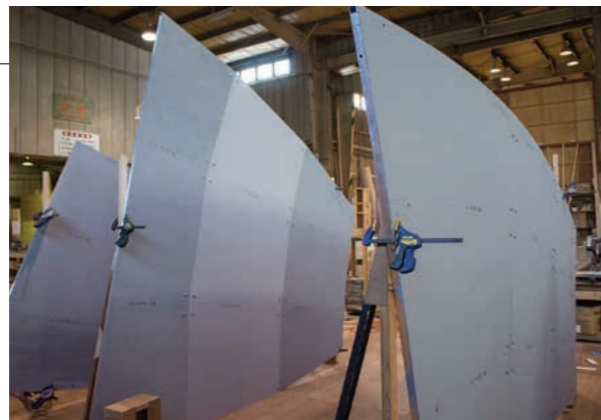
まだ現時点ではパーツごとですが、これが組み合わさると……？