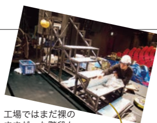
工場ではまだ裸のままだった階段も……こんな仕上がりに！

搬入の日。トラックで自由劇場に運ばれてきた資材をスタッフが手際よく次々に運び込み、あっという間に荷卸しは完了。装置ごとに分かれて作業を進め、新舞台装置が少しずつその姿を現し始めました。舞台上にはどんどん近未来の世界が広がっていきます。