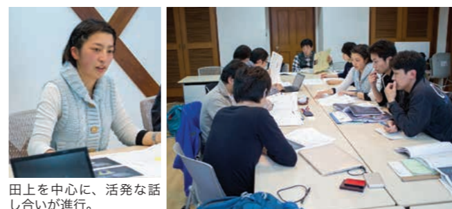
田上を中心に、活発な話し合いが進行。

決定したデザイン画をもとに舞台装置の設計図を描き、打ち合わせを重ねて実際の出来上がりの仕様を決めていきます。打ち合わせには、舞台監督や照明スタッフ、舞台製作に関係する外部企業の担当者なども参加します。劇団四季専用劇場公演での使い勝手のみならず、のちの全国公演での移動も考慮し、バラし（片付け）やすさ、トラックへの積みやすさなどを含めて検討。使用する資材についてどんな工夫ができるかなど各々意見を出し合い、完成時の色味や質感などイメージ通りの見た目となるよう、模索していきます。