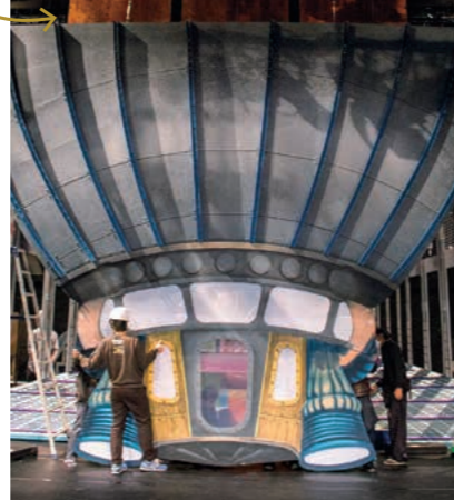
ロケットが出現しました！